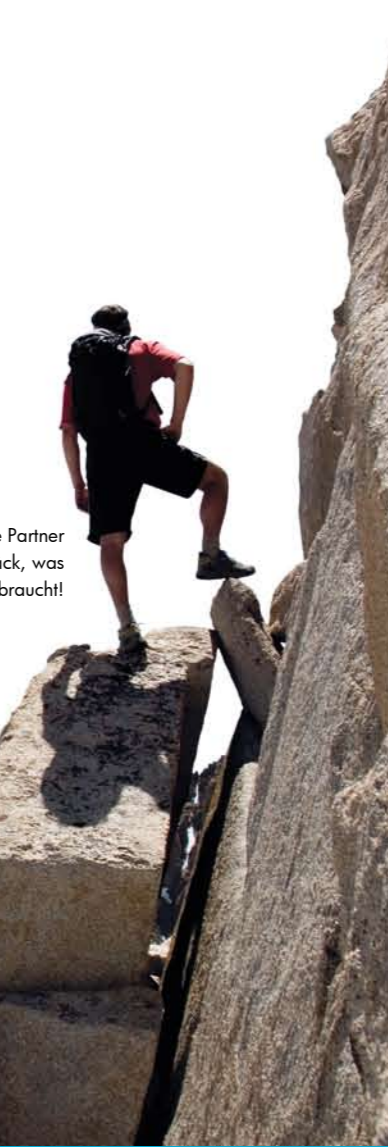
Mit Ihrem Frontline Partner haben Sie alles im Gepäck, was Ihr Business morgen braucht!

Frontline Partner sind die Top-Experten für IT-Lösungen von HP und Microsoft und bieten Ihnen höchste Qualität bei Beratung, Implementierung und Support.